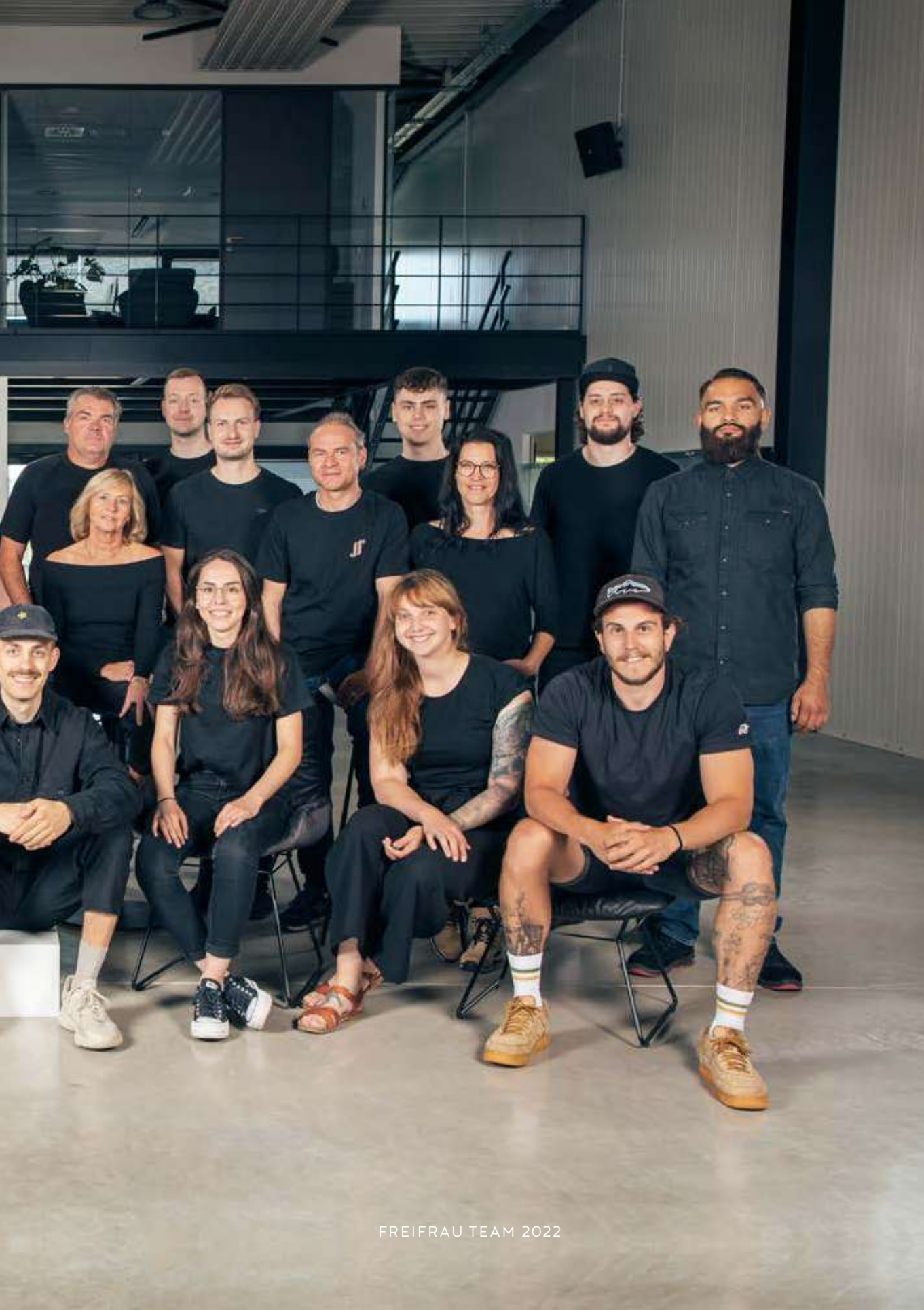
FREIFRAU TEAM 2022