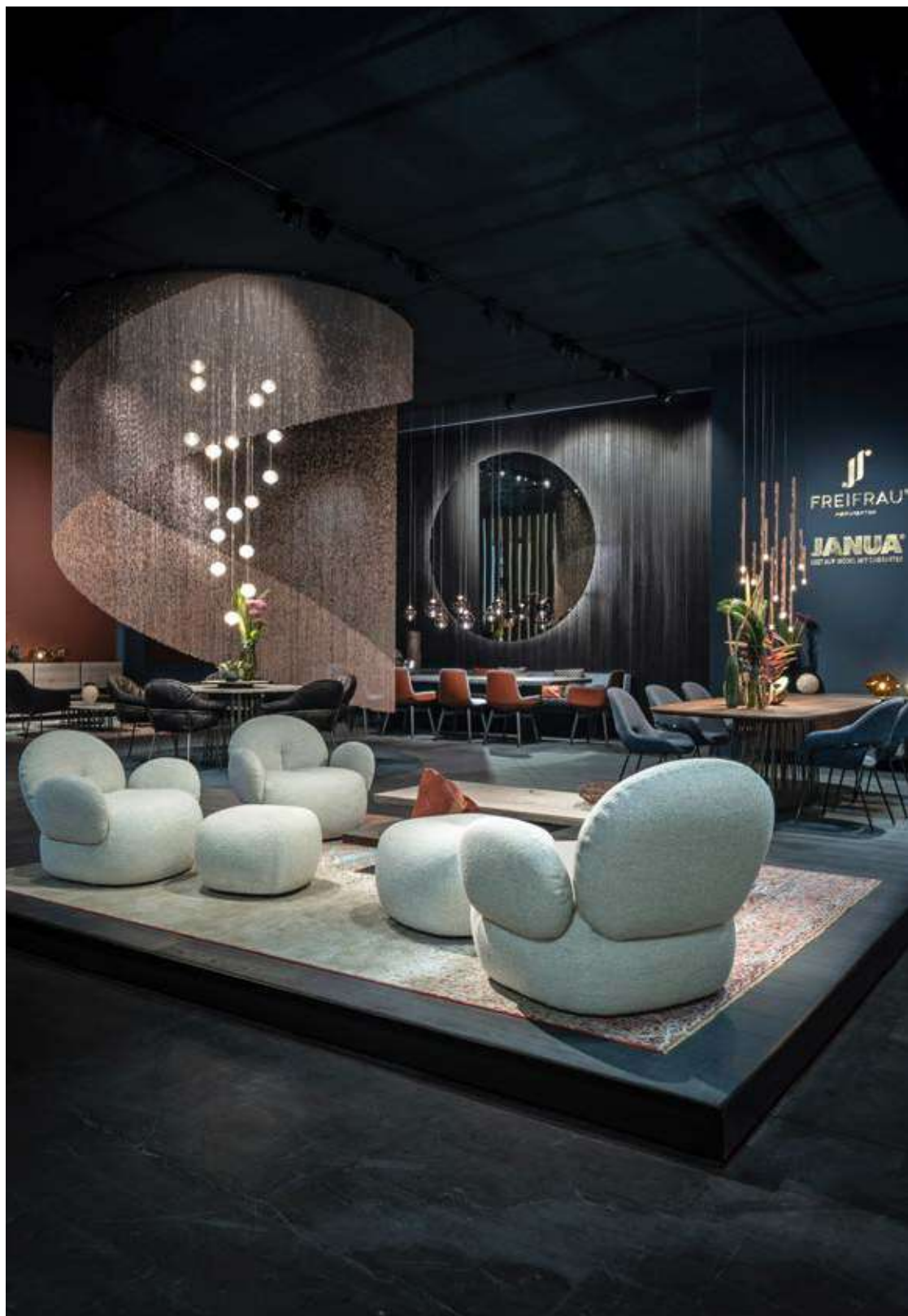
SALONE DEL MOBILE MILANO 2023