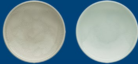
PLATE DEEP COUPE STRUCTURE

ASSIETTE PLATE COUPE STRUCTURE | PIATTO PIANO COUPE RILIEVO | PLATO ILANO COUPE RELIEVE