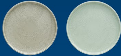
PLATE FLAT COUPE STRUCTURE

*Colour Glaze STEAM = A1 *Colour Glaze FROST = B1